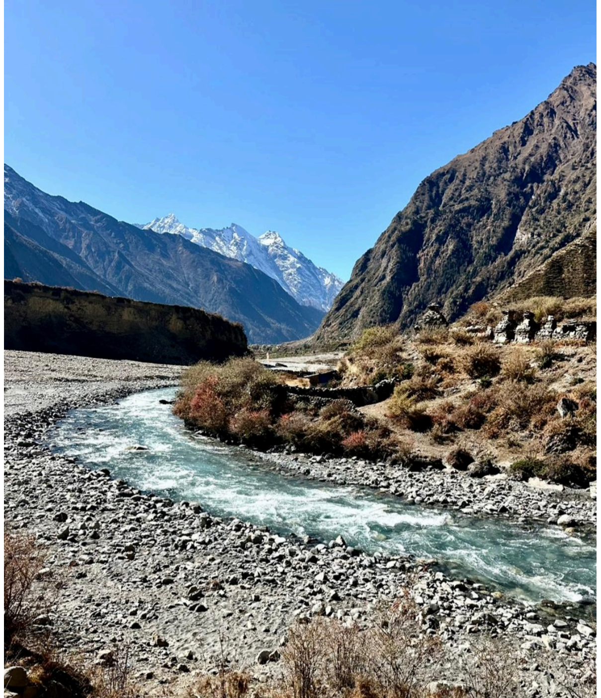
Rivière Budhi Gandaki

🏠 Lodge | 🍴 Petit déjeuner, déjeuner et dîner inclus | ⬆ + 265m | ⬇ - 1615m |