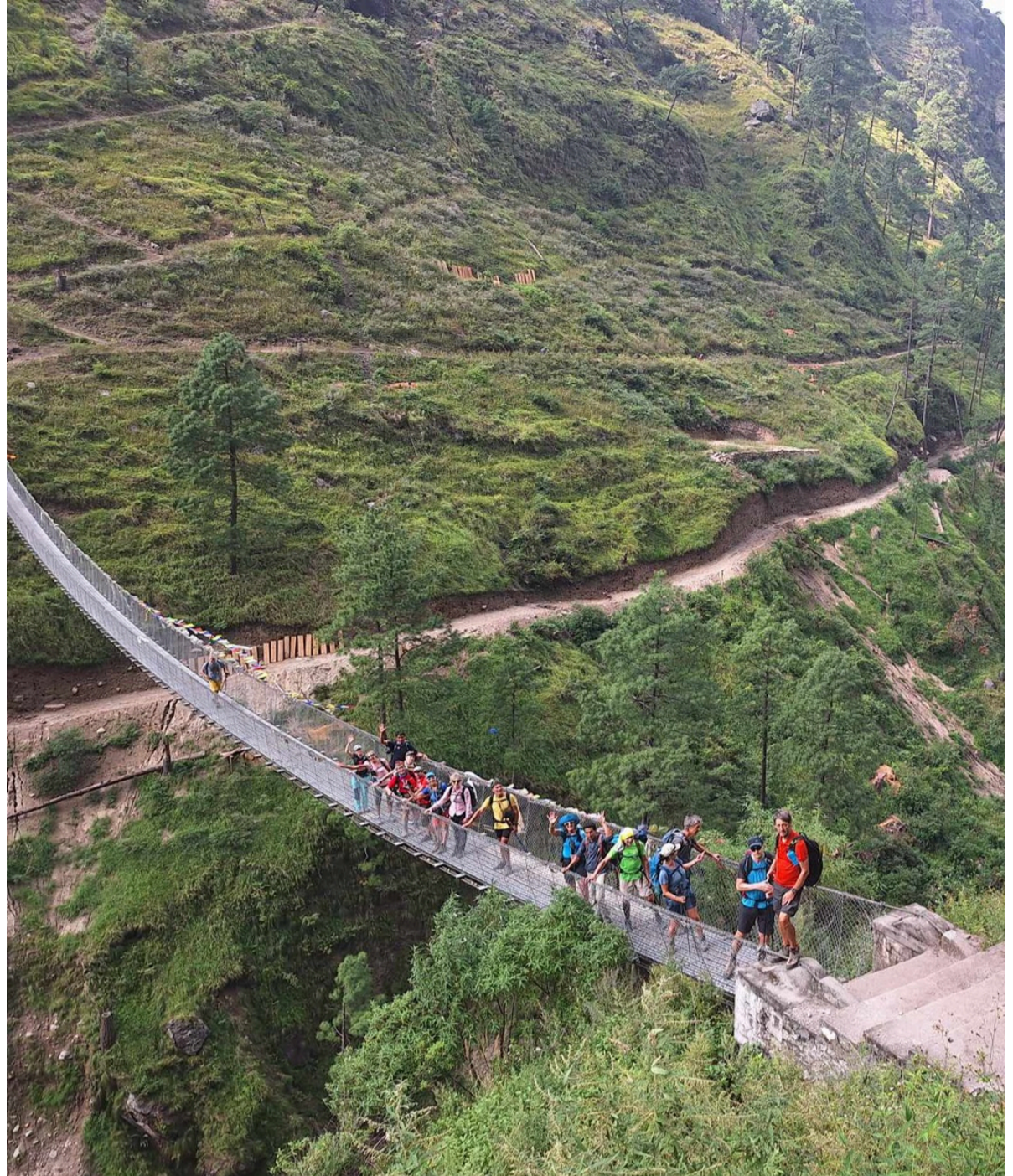
Photo pont suspendu à Philim

🏠 Lodge | 🍴 Petit déjeuner, déjeuner et dîner | ⬆ + 1100m | ⬇ - 700m |