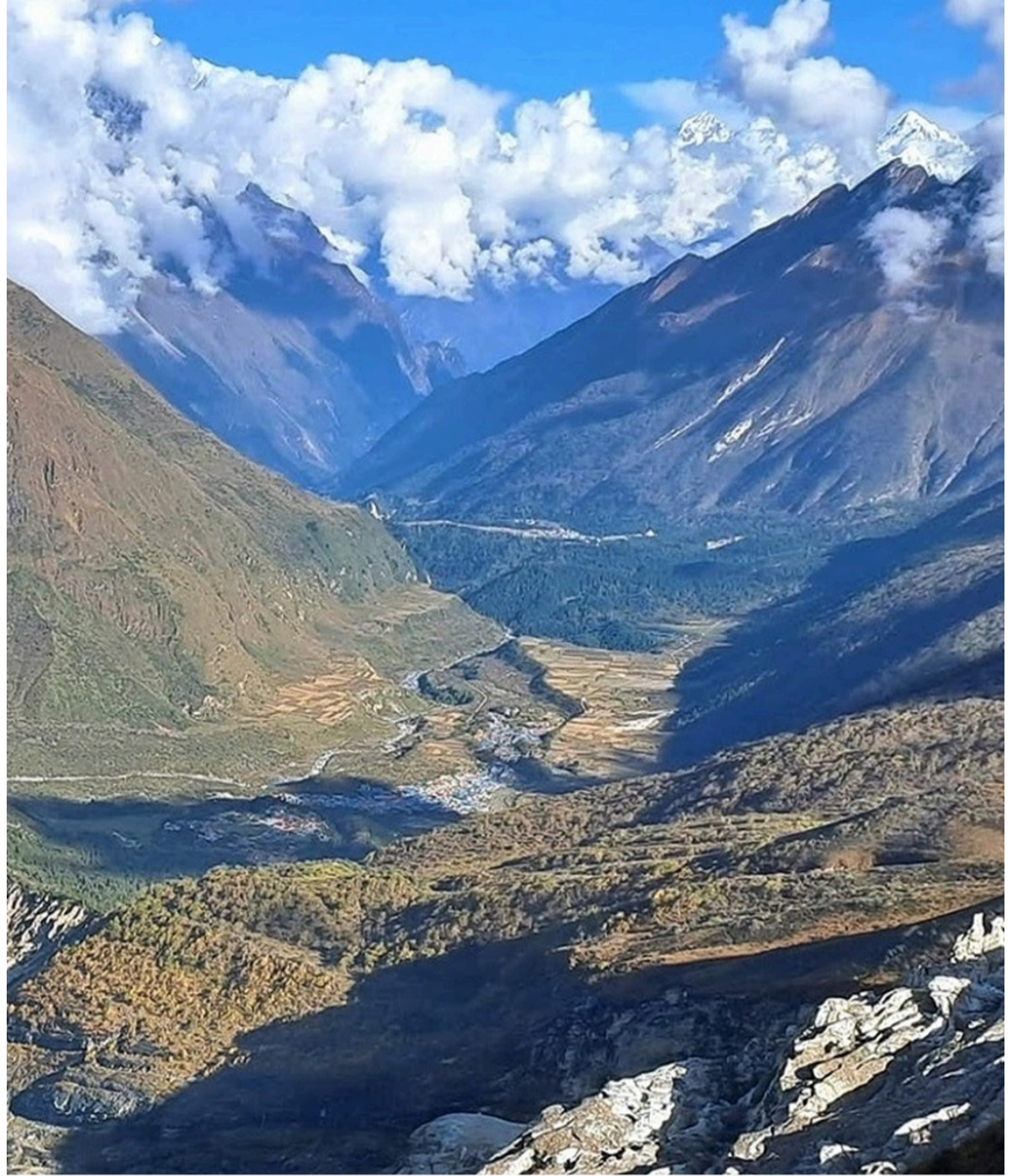
Vue sur Samagau et SAMDUP village

🏠 Lodge | 🍴 Petit déjeuner, déjeuner et dîner inclus | ⬆️ + 1350m | ⬇️ - 490m |