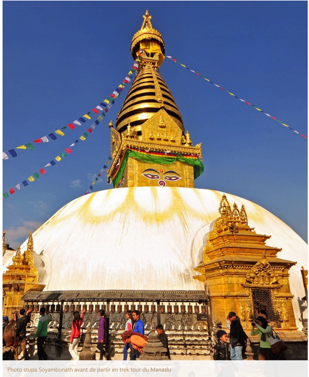
Photo stupa Soyambunath avant de partir en trek tour du Manaslu

Briefing et présentation du déroulement du séjour. En cas d'arrivée le matin, journée de repos ou possibilité de visiter le quartier touristique de Thamel, pour ceux qui le souhaitent, votre hôtel est situé au cœur de la ville touristique.