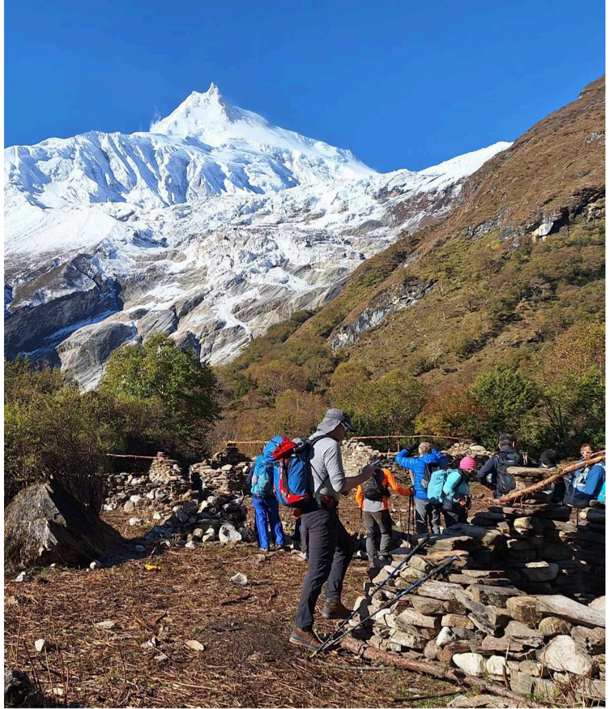
Vue sur manasslu 8163m depuis SHYALA