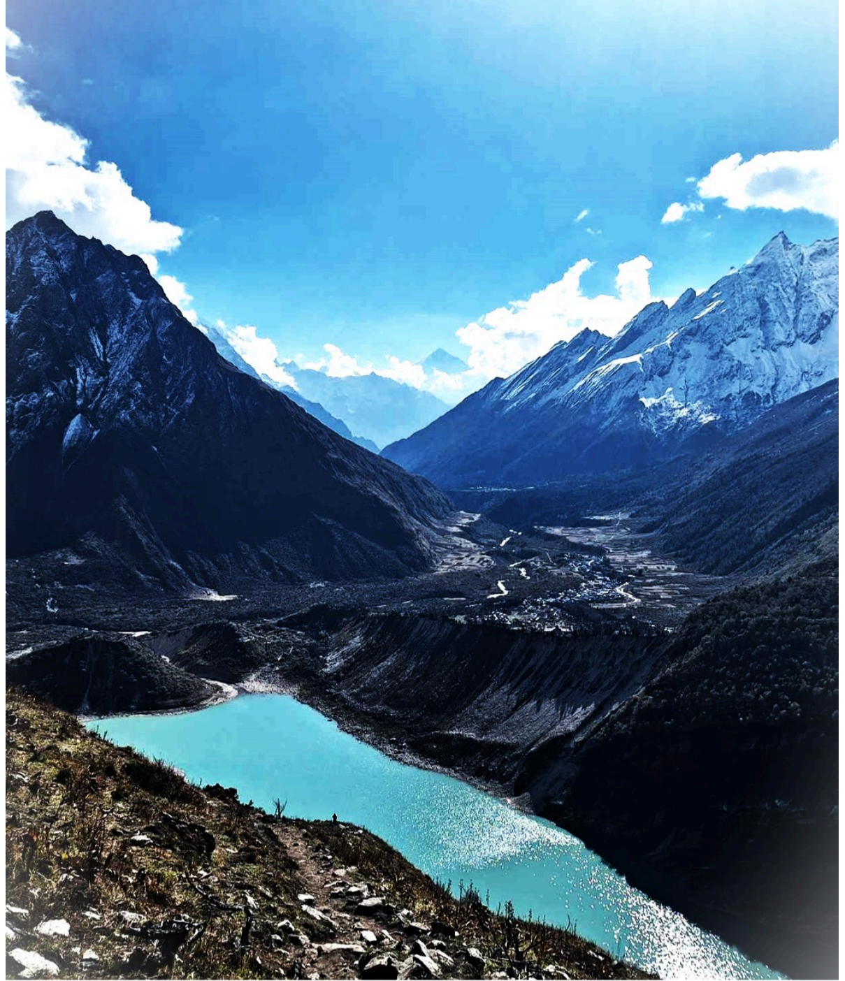
Lac Birendra près de village SAMA gau

🏠 Lodge | 🍴 Petit déjeuner, déjeuner et dîner inclus | ⬆ + 450m | ⬇ - 150m |