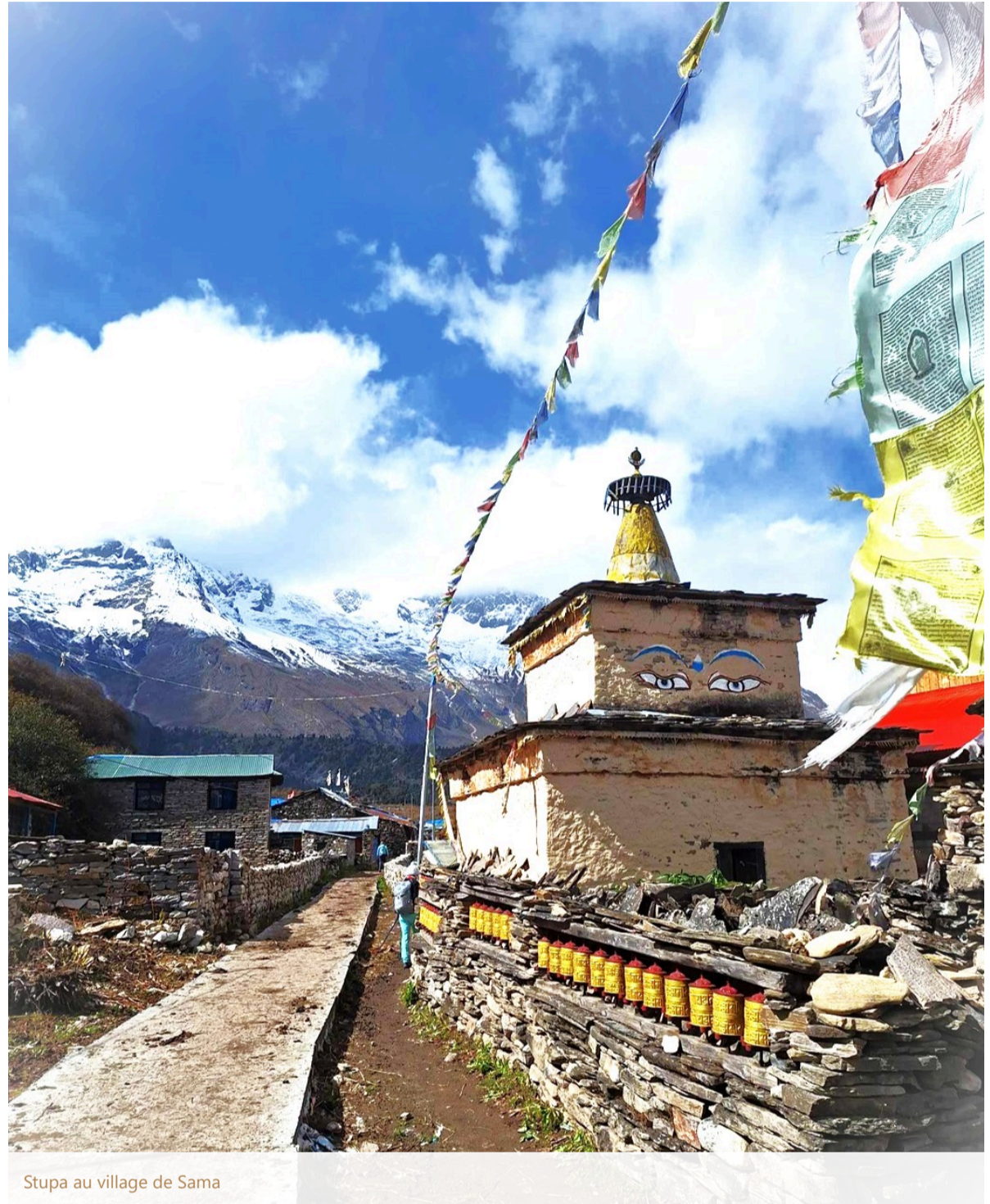
Stupa au village de Sama

NB : À Dharmasala, l'hébergement se fait en lodge basique ou en tente fixe, avec un confort très simple. Les conditions restent sommaires en raison de l'altitude et de l'isolement du site, mais l'expérience est authentique et typique des grands treks himalayens.