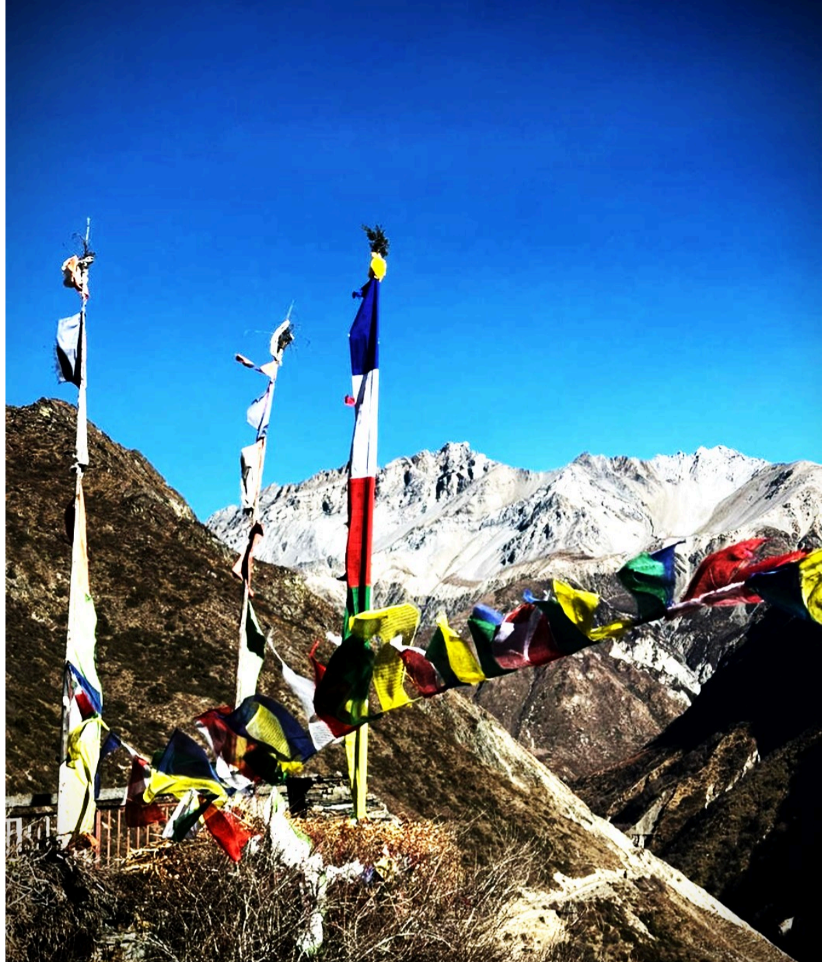
Drapeaux prière à Shyala

🏠 Lodge | 🍴 Petit déjeuner, déjeuner et dîner inclus | ⬆ + 1100m | ⬇ - 250m |