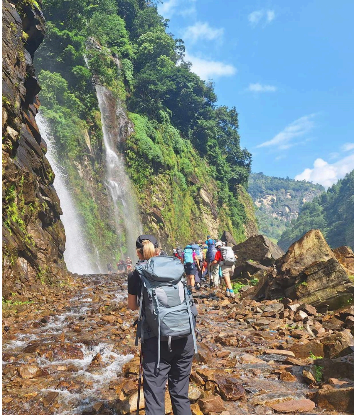
Cascade d'eau Machakhola

🏠 Lodge | 🍴 Petit déjeuner, déjeuner et dîner | ⬆️ + 1100m | ⬇️ - 750m |