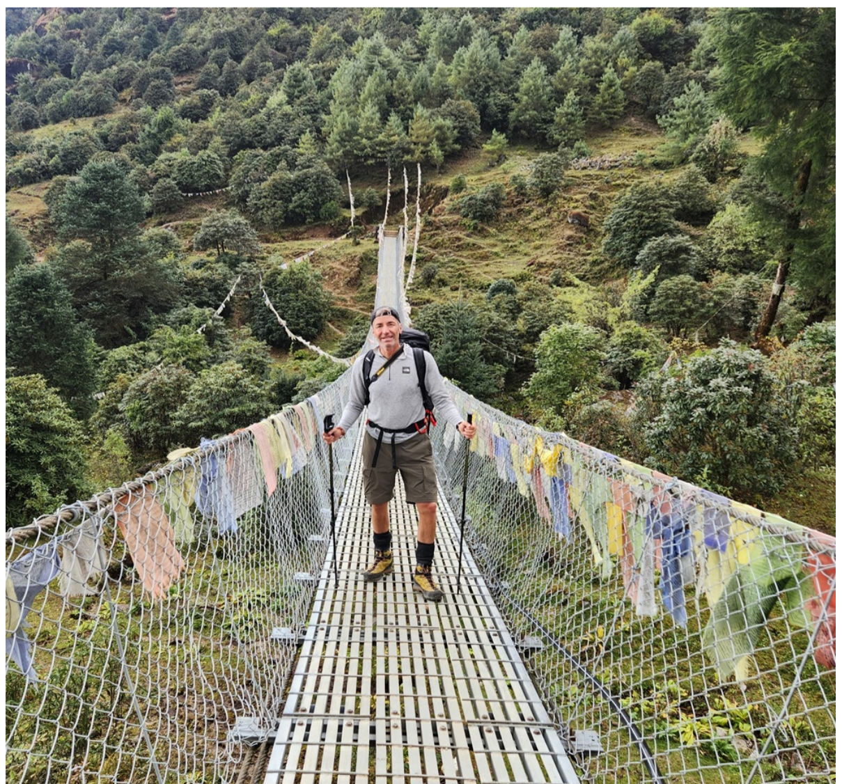
Pont suspendu au Népal sur le trek du Manaslu

Journée de repos essentielle à Samdo (3 860 m) pour favoriser une bonne acclimatation à l'altitude avant le passage du col du Larkya La. Situé près de la frontière tibétaine, ce village authentique offre une atmosphère unique et préservée. Plusieurs balades sont possibles dans les environs, notamment en direction des collines surplombant la vallée, offrant de superbes vues sur les sommets environnants et les glaciers. Ces marches légères permettent de s'acclimater efficacement tout en profitant des paysages. Une journée clé pour optimiser vos chances de réussite et apprécier pleinement la suite du trek.