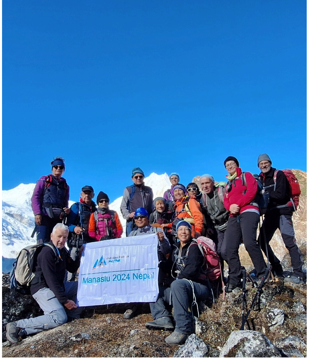
Photo camp de base de manaslu avec group Club Alpin Français de Meythet